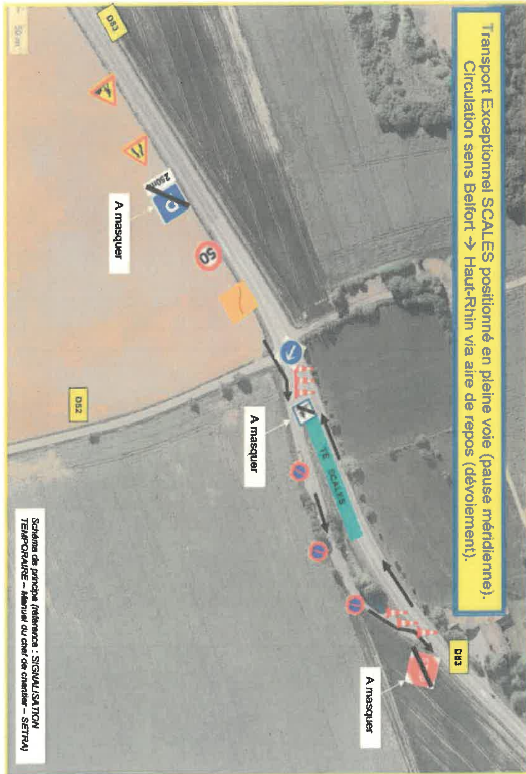
21 - RD83 - TE SCALES - Dévolement Aire de pique-nique

Déviation spécifique au niveau du croisement de la RD 83 et de la RD 52 au droit du lieu dit " Ferme Gérig" à Menoncourt